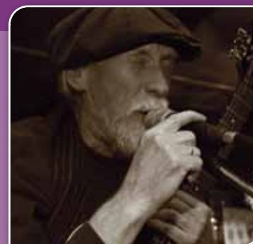
Café Bar De Dependance Rolderstraat 5