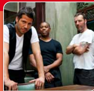
British Pub Cheers Kerkstraat 27