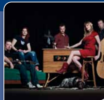
Café Bar Cosy Corner Markt 1